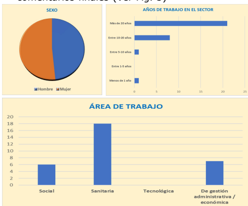
Fig. 2: Características de la muestra: sexo, años de trabajo en el sector y área de trabajo