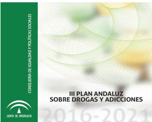
Fig. 1: Libro del III Plan Andaluz Sobre Drogas y Adicciones.

La encuesta se realizó mediante el sistema electrónico a distancia LIMESURVEY de forma anónima, voluntaria y sin remuneración económica.