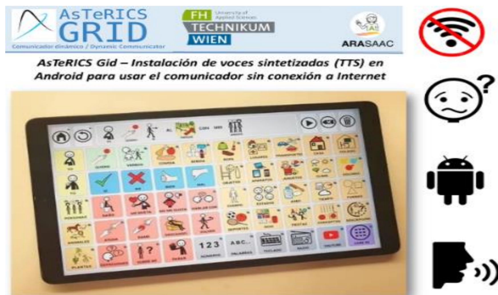
Fig. 1: Comunicador AsTeRICS Grid (ARASSAC)