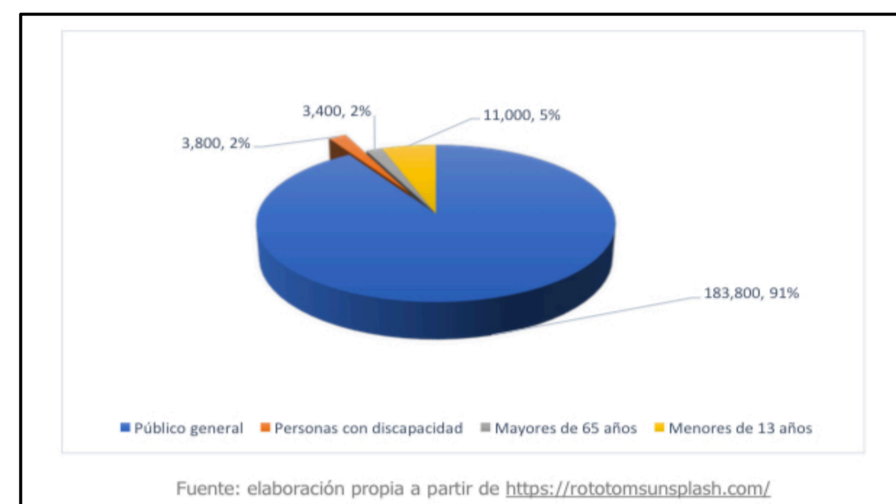
Fig. 3: Asistentes Rototom Sunsplash 2019