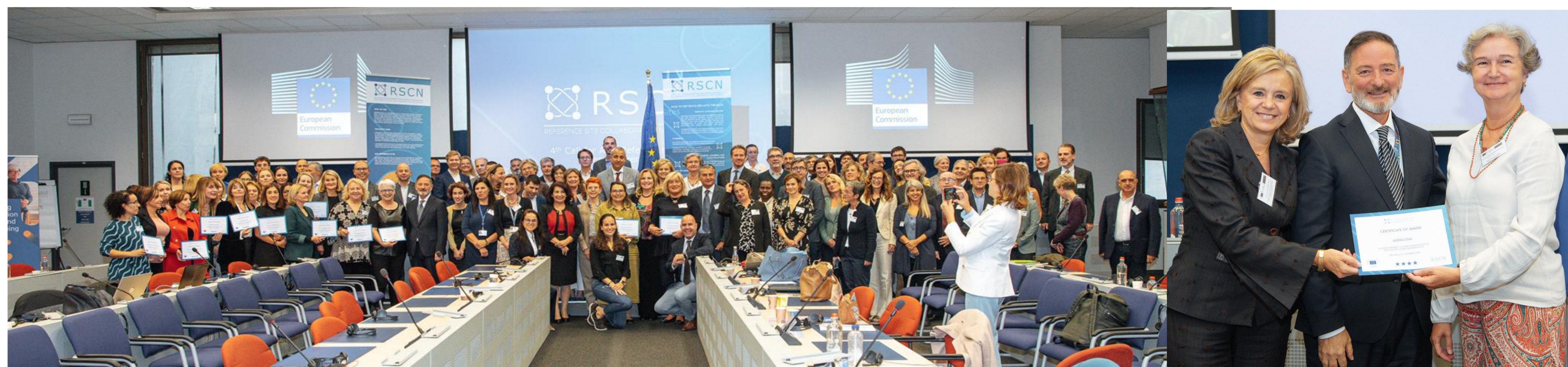
Fig. Acto de entrega de las acreditaciones de Sitios de Referencia - RSCN AHL - con el número de estrellas conseguido